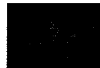
Enrique Iglesias 'mata' a 'La chica de ayer'