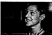
Polémica por el himno franquista en Yakarta