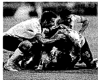
El Real Zaragoza, con 12 disparos a puerta por partido y un medio del 54% de precisión...