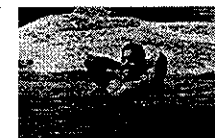
Un embrollo a la uruguaya