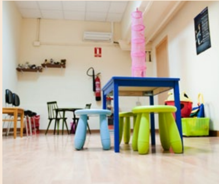
Se intenta crear un entorno lo más agradable posible.