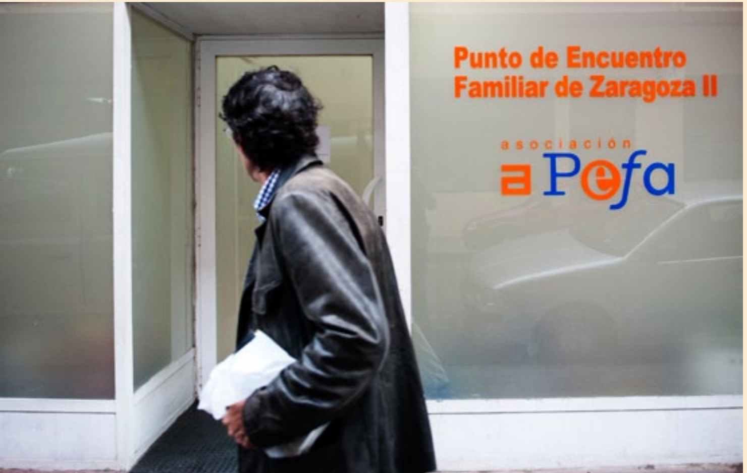
APEFA acaba de inaugurar un nuevo Punto de Encuentro Familiar en Zaragoza.