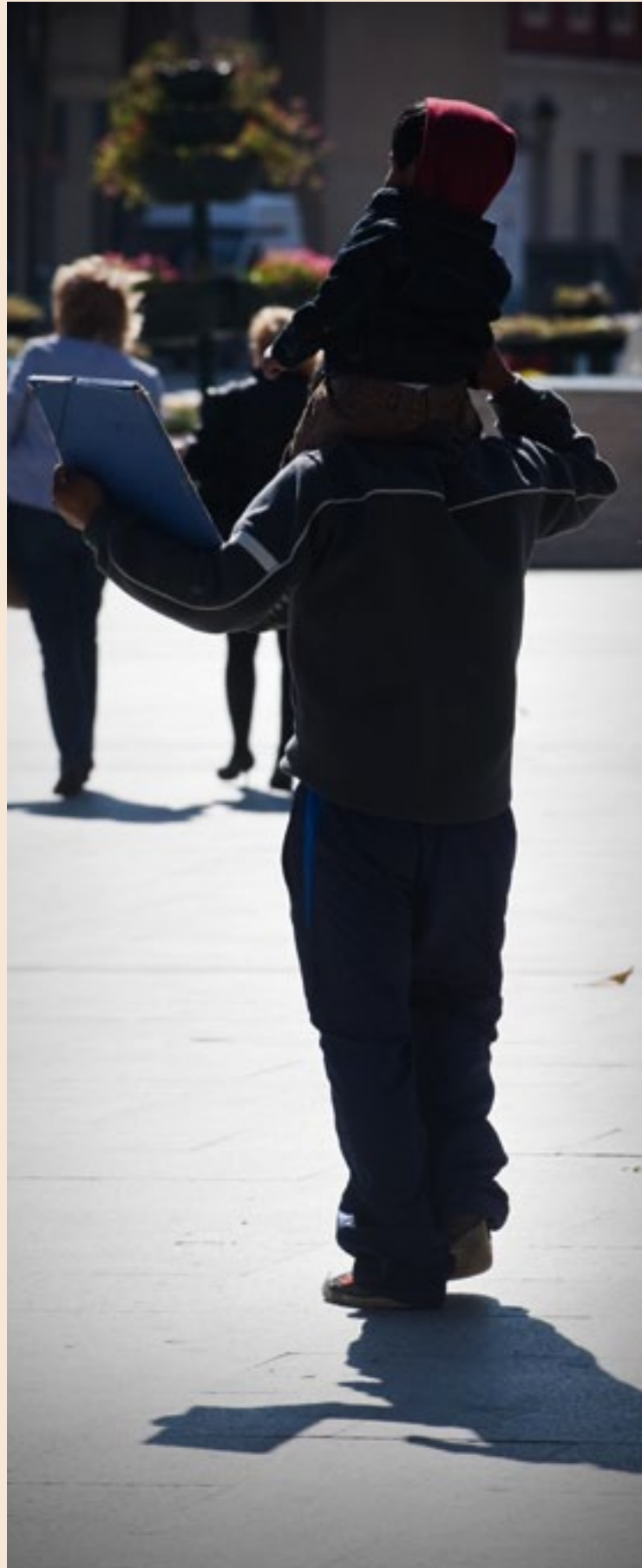
Los puntos de encuentro favorecen la relación entre el menor y sus progenitores.